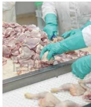
Agricultura Agricultural Industry