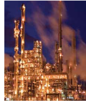
Industria Energetica, Resurse naturale si Reinnoibile Energy Industry, Natural & Renewable Sources