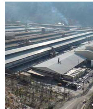
Reciclare si Tratarea Deseurilor Recycling & Waste Treatment