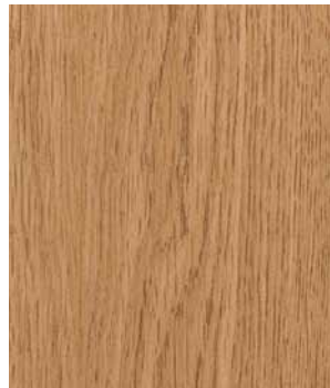
Industria tutunului Tobacco Industry