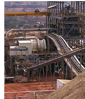
Marmura, Caramizi si Industria Tigla Marble, Brick & Tiles Industry